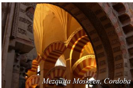
Mezquita Moskeen, Cordoba