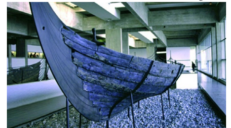
Vikingsmuseet på Borg